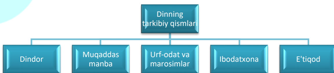
1-rasm. Dinning tarkibiy qismlari 24

T.E.Stenyakova fikricha, diniy turizm durli konfessiyadagi insonlarning ehtiyojlariga asoslanadigan turizm. Ziyorat yoki diniy maqsadlardagi sayohat esa chuqur qadimiy ildizlarga ega tarixiy turizm shaklidir 23 . Bilamizki, ehtiyoj insonning yashashi, rivojlanib borishi hamda kamol topishi uchun kerakli hayotiy vositalarga bo‘lgan zaruriyat.