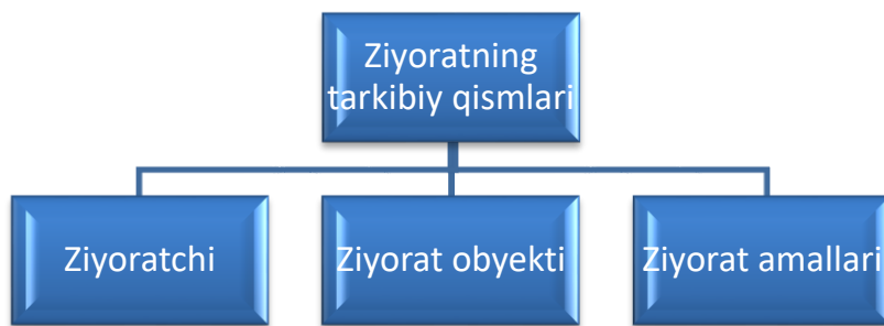
2-rasm. Ziyoratning tarkibiy qismlari 25

„Ziyorat” hamda „diniy turizm” tushunchalari o‘xshash biroq, maqsadlar, motivlar, maqsad qo‘yish (целеполаганиям) va shu kabilarda farqlanadi. Diniy turizm ziyoratga juda ham yaqin turadi. Bu „haqiqiy ziyorat” darajasiga chiqmagan biroq, anglash turizmi endilikda ularni qoniqtirmaydigan turistlar uchun mo‘ljallangan ziyoratdir. Aynan ular uchun diniy turizm, ta’lim va ma’rifiy maqsadlarda muqaddas joylarni ziyorat qilish mavjud 26 .