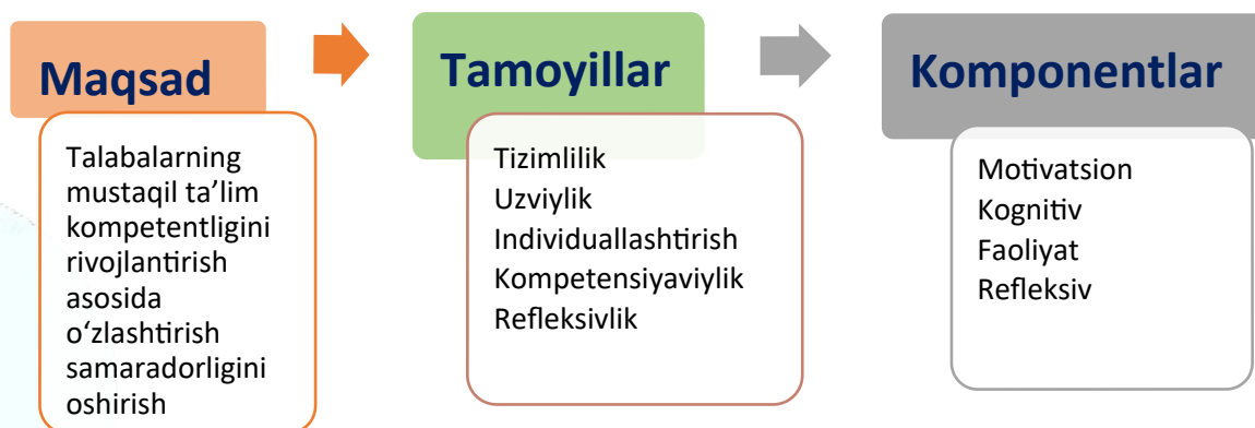
1-rasm. Mustaqil ta'lim samaradorligini oshirishga olib keluvchi model

chiqilishi lozim. Bu model 1-rasmda ko'rsatilgani kabi maqsad, tomyillalr va komponentlardan iborat.